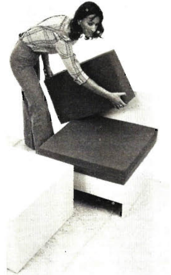
Die Grundelemente in verschiedenen Höhen gestapelt