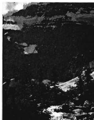
Die schneebedeckten Gipfel des Mount Edith Cavell ergeben eine imponierende Kulisse für einen der Gebirgsbäche, die den Jasper-Nationalpark im Nordwesten Kanadas durchfließen