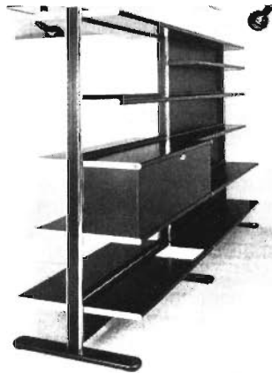
Vielseitiges Aluminium-Regalsystem

den. Die Tragschienen sind entweder verchromt oder schwarz oder grauweiß eloxiert; die Aluminium-„Bretter“ gibt es in ihrer natürlichen Farbe oder schwarz oder braun (Wingset-Regalsystem, Hersteller: Gebrüder Vieler GmbH, Postfach 71 06, 5860 Iserlohn-Letmathe). kb