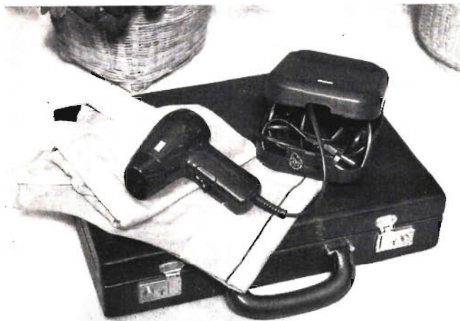
220 oder 110 Volt: Mini-Foen

Steckdosensysteme – vor allem aber: er ist besonders klein und hat trotz einer Leistung von 500 Watt bis 1000 Watt ein Gewicht von nur 190 Gramm (Hersteller: AEG-Telefunken Hausgeräte, Muggenhofer Straße 135, 8500 Nürnberg 80). kb