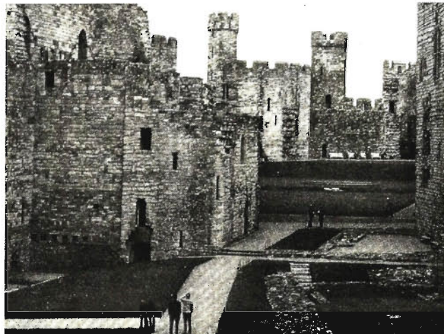
Die Burg Caernarvon in Wales, Ort der Investitur von Prinz Charles, wird im Rahmen einer England-Wales-Rundreise, veranstaltet von Windsor-Tours, besucht

lantikinseln Herm und Sark und der Isle of Wight. Neu ist eine achttägige England- und Walesrundreise. Besucht werden einige der berühmtesten Burgen und Schlösser von Wales, die 1983 ihr siebenhundertjähriges Bestehen feiern, wie etwa die Burgen Caernar-