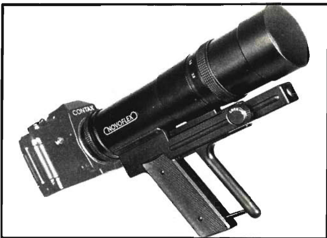
Schnellschußobjektiv 200 mm

gedacht ist. Das Blitzgerät besitzt eine Leitzahl von 20 (bei 21 Din), die durch eine Diffusorscheibe auf eine Leitzahl von 15 verringert werden kann. Eine Belichtungstabelle zeigt je nach Balgenauszug und Objektivkopf die richtige Blende an. Zu den Objektiven der Fa. Novoflex gesellt sich als Neuheit das „schnellste Zweihundertter“. Die Scharfstellung erfolgt durch Druck auf einen