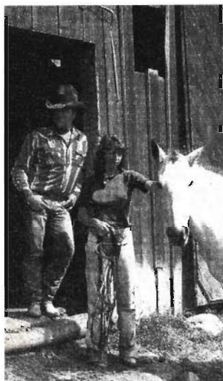
Den Umgang mit Pferden lernt man auf der Focus-Ranch in Colorado und auch sonst alles, was mit dem Leben auf einer Ranch zu tun hat

Erlebnisreisen, die im Westen und Mittleren Westen der USA und Kanadas vielfach abseits gewohnter Routen durch eindrucksvolle Landschaften oft zu kaum bekannten Sehenswürdigkeiten führen, stehen im Mittelpunkt der „Marlboro Abenteuer Reisen 1983“. Neun dieser Unternehmungen werden mit kleineren Gruppen per Minibus im Campingstil unternommen. Zur Wahl stehen achttägige bis sechs-