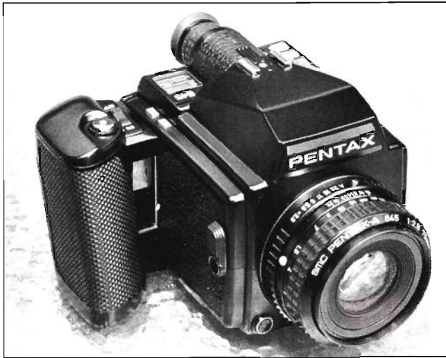
Die Pentax 645 mit Mehrfach-Automatik