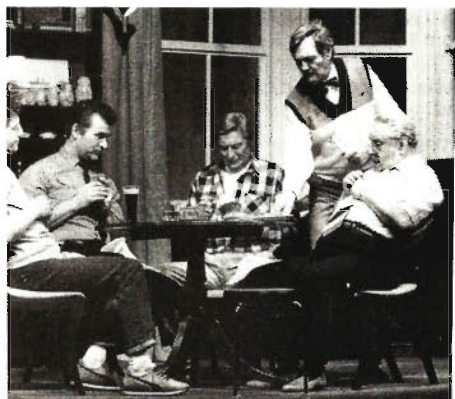
Regie der Komödie „Ein seltsames Paar“ führt einer der Darsteller: Harald Leipnitz