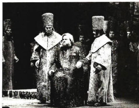
Martti Talvela singt die Titelpartie in Musorgskis „Boris Godunow“, eine Neueinstudierung an der Deutschen Oper Berlin