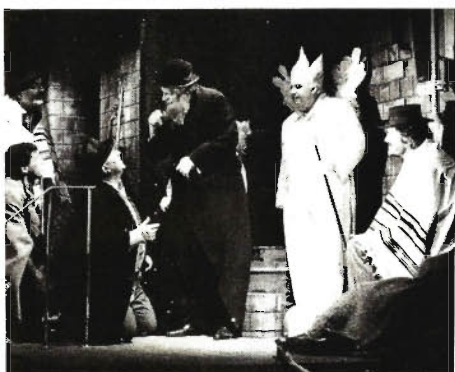
„Berlin Alexanderplatz“ als weltliches Mysterienspiel, inszeniert von Rainer Behrend