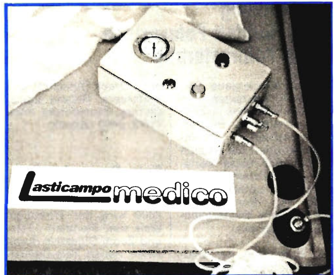
Gymnastikmatte mit Luftpumpe

sichtige, trittfeste PVC-Beschichtung. Kork ist so elastisch, daß nach Angabe des Herstellers selbst Delen von Stuhlbeinen oder Pfennigabsätzen wieder verschwinden. Als Unterlage benötigt man eine völlig ebene Fläche. Für eine nicht gleichmäßige oder nicht völlig trockene Unterlage kann man die Korkplatten auch schon auf Holzfaserplatten fest verklebt bekommen (Cork-o-Plast von Wicanders GmbH, Regenbergastraße 14, 2000 Düsseldorf). kb