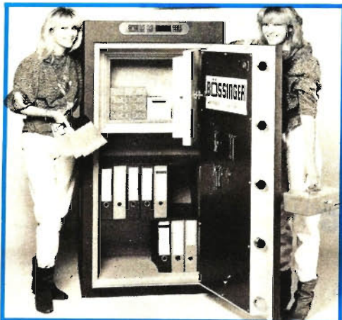
Tresor, geteilt für Wertsachen und für Datenträger

Gegenstände. Um Platz zu sparen, kann man beides vereinigen: Die „Duo-Wertschränke“, die es in zwei verschiedenen Größen gibt, haben ein geteiltes Innenleben. Der Tresor selbst ist feuersicher ausgelegt, im Inneren befindet sich aber noch ein zweites