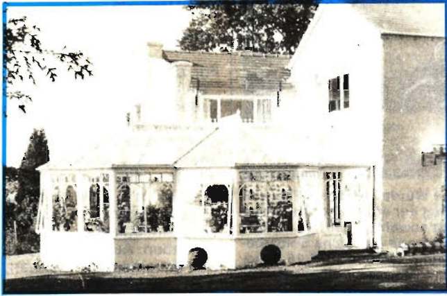
Viktorianisches Gartenhaus, in England nachgebaut

Ganz im Stil des viktorianischen 19. Jahrhunderts ist ein Wintergarten gehalten, der an das Haus angebaut werden kann. Es gibt eine achteckige Grundform, die aber fast beliebig variiert werden kann, weil der Bau aus kompletten Fertigteilen zusammengesetzt wird. Das Material ist ein gebeiztes und grundiertes