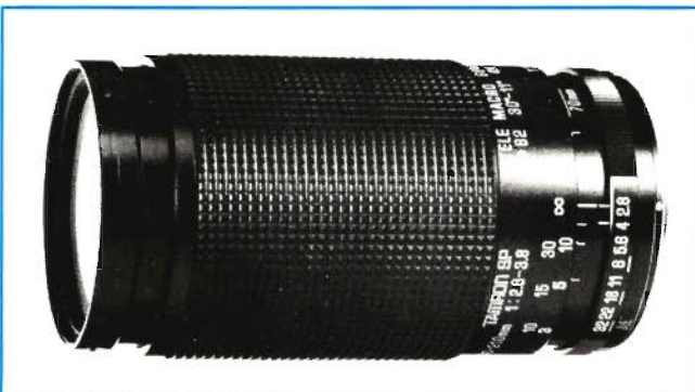
Tamron SP 2,8–3,8/70–210