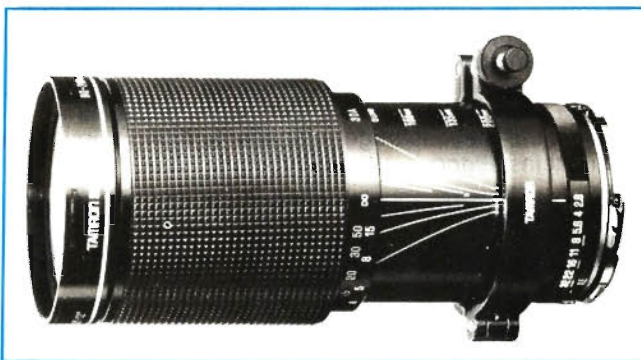
Tamron SP 2,8/80–200

Filtergewinde 77 mm, Länge 169 mm. Auch beim Zoom 2,8–3,8/70–210 läßt sich die Blende bis 32 schließen. Kürzeste Entfernung 0,85 m. Filtergewinde 62 mm. Länge 12 mm. Tamron, Benzstraße 11, 6054 Rodgau). HO