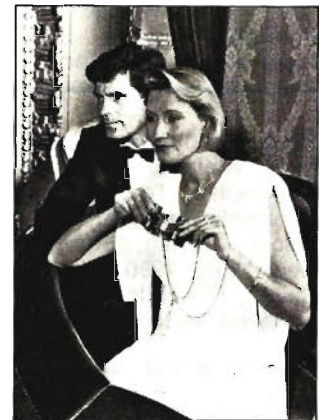
Theaterglas „Diadem“

Selbst in der kleinsten Wohnung kann man sich einen Schäferhund leisten – er ist bescheiden und pflegeleicht, denn er besteht aus einer Tonkassette und einem elektronischen Steuergerät. Dieses Gerät wird auf Geräusche aus dem Bereich der Wohnungstür programmiert. Gibt es solche Geräusche, dann schaltet es den Kassettenrekorder mit dem Tonband an, und ein Schäferhund bellt in zwanzig verschiedenen Bell-Variationen solange, bis kein Geräusch mehr an der Tür vorhanden ist. Vermutlich wird man auch selbst von diesem elektronischen „Hund“ begrüßt, wenn man nach Haus kommt und die Tür aufschließt (Hersteller: Günther Apparatebau, Daxlanderstraße 66, 7500 Karlsruhe 21). kb