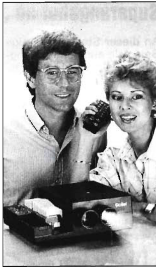
Bild rechts: Der 35 twin von Rollei macht Überblendung mit einem Projektor und aus einem Magazin möglich

Der Rolleivision 35 twin vereint zwei komplette Projektionssysteme und ermöglicht Überblendung mit nur einem Projektor und aus einem Magazin. Der Fachhandel nimmt alte Projektoren zum Zeitwert in Zahlung (Rollei Foto-technic, Postfach 32 45, 3300 Braunschweig). Or