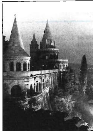
Das heutige Ungarn, der Weg, den dieses Land seit 1956 zurückgelegt hat, bilden das eigentliche Thema des Films „Ungarn, geboren 1956“ – die Geschichte des Isvan N. (Zu sehen am 21. Oktober um 23 Uhr im Dritten Fernsehen West). Das Foto zeigt die Fischer-Bastei, ein Wahrzeichen Budapests

„Ich weiß nicht, wie es passieren konnte.“ Von Menschen, die einen Verkehrsunfall verursacht haben. ZDF, 23. Oktober, 21 Uhr. □