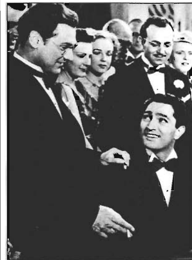
George Gershwin (Robert Alda, am Klavier) begeistert die Zuhörer mit seinen Kompositionen ( ZDF, 3. Mai)

George Gershwin, 1898 in Brooklyn/New York als Sohn