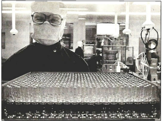
Durch konsequente Einhaltung der Hygieneregeln, die denen zum Schutz vor Hepatitis B entsprechen, können sich Ärzte und Hilfspersonal vor einer Aids-Infektion schützen.

Im ersten Teil soll über die Krankheit Aids und über die Hilfen für HIV-Infizierte informiert werden. Unter anderem wird das „Berliner Modell“ vorgestellt: Gezielte Ansprache der Risikogruppen, sozialpsychologische Betreuung der Erkrankten, Aufklärung in den Schulen. Im zweiten Teil sollen Experten insbesondere die ethischen, religiösen und politischen Aspekte diskutieren. Zur Teilnahme wurden unter