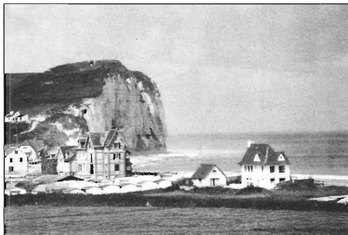
Grémillons Film beginnt mit Bildern einer reichen Kulturlandschaft der Departements Manche und Calvados

dischen, amerikanischen und deutschen Soldaten fielen bei der „Befreiungsschlacht“. Ein Dokumentarfilm (Der sechste Juni, im Morgengrauen, 1944), den Jean Grémillon im Jahre 1944/45 drehte und den das Dritte Fernsehen West am 10. Juli um 23.05 Uhr sendet, zeigt, welche Folgen das Kriegsgeschehen