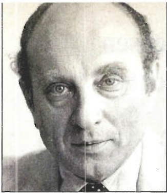
Dr. Otto Graf Lambsdorff