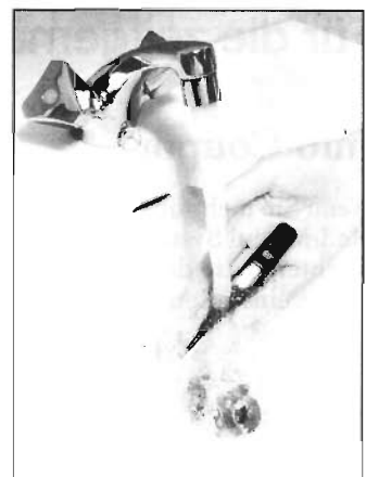
Hier das wasch- und desinfektionsfeste Digital-Fieberthermometer

Ein neues digitales, elektronisches Fieberthermometer ist rundherum wasserfest. Man kann es nach der Benutzung unter fließendem Wasser abspülen oder auch in ein Desinfektionsbad tauchen. Das Thermometer hat einen Memory-Speicher, ein akustisches Signal und eine Batteriekontrolle (Bezug über Apotheken oder von Roland Arzneimittel GmbH, Postfach 73 80 20, 2000 Hamburg, 73). kb