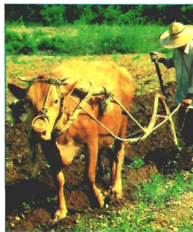
In der Stadt Hochhäuser, auf dem Land noch der Holzpflug

Wir lernten Südkorea als ein Land zwischen effizienter Modernität und bezaubernder Vergangenheit kennen. Dank der sprichwörtlichen Intelligenz, Geschicklichkeit und Beharrlichkeit der Koreaner hat sich die Halbinsel innerhalb zweier Jahrzehnte von einem armen Dritte-Welt-Land zu einer hochentwickelten Industrienation emporgearbeitet. Kein Wunder also, wenn heute Glas-