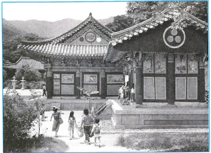
Drei Kugeln bezeichnen die „Juwelen“: Buddha, Lehre, Gemeinde

Auch das im Südwesten gelegene Kyongju, das Mekka aller Touristen, wäre heute noch ein verschlafenes Dorf, hätten nicht Anfang der 20er Jahre Bauarbeiter beim Abtragen einer Rasenkuppe ein paar Glasperlen entdeckt. Bei näherem Hinsehen entpuppte sich der nutzlose Erdhügel als Königsgrab aus jener Zeit, in der Kyongju als Hauptstadt des einst mächtigen Silla-Reiches den Ton angab. In den darauffolgenden fünfzig Jahren wurde die tausend Jahre verschollene Kultur wieder ans Licht gerückt. Heute präsentiert sich Kyongju, das die Unesco 1979 unter die zehn bedeutendsten Kulturstätten einreichte, als Museum ohne Mauern. Inmitten der nun 100 000 Einwohner zählenden Provinzstadt erheben sich Dutzende von Hügelgräbern, wurden königliche Paläste und buddhistische Tempel, Statuen und Reliefs restauriert, wovon in erster Linie die Koreaner profitieren. Für sie ist Kyongju die Heimstätte ihrer stolzen Vorfahren, hier wird ihr Traum von vergangener Größe bewahrt. Anders als die alte Silla-Metropole können die mei-