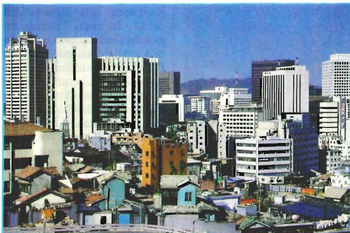
Explosiv in die Höhe geschossen: die 10-Millionen-Stadt Seoul

Trotz fortschreitender Industrialisierung leben noch 35 Prozent der Bevölkerung von der Landwirtschaft. ▽