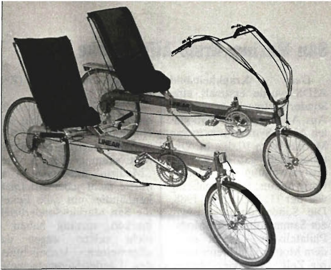
„Linear“-Fahrrad aus Amerika