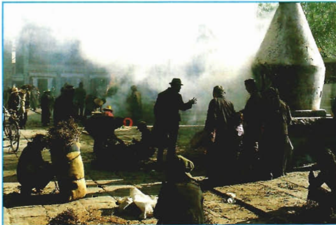
Weihrauchopfer vor dem Jokhang-Tempel in Lhasa

Mit dabei sind sechs Sherpas, die die Gruppe auf dem Weg zum Kailash betreuen