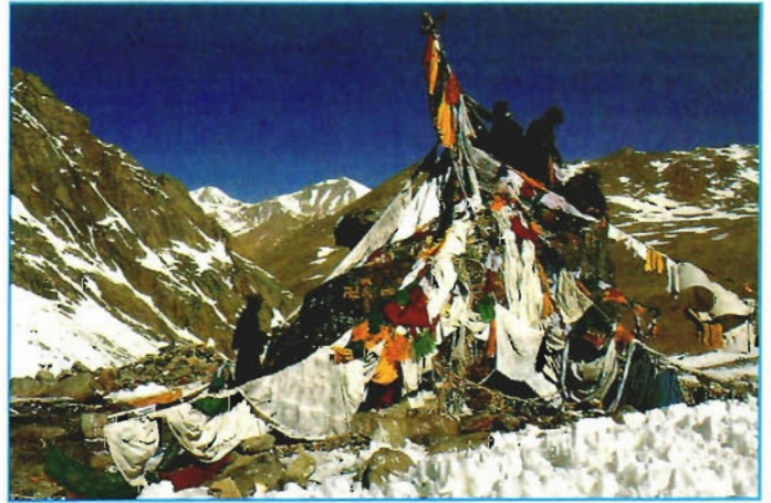
Der Dölma-La ist der höchste Punkt der Kailash-Umrundung