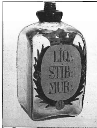
Vierkantflasche, wohl aus dem Fichtelgebirge, 1. Hälfte des 18. Jahrhunderts, 12,5 cm hoch, Schätzpreis 1500 DM

Den reich, teils in Farbe illustrierten Auktionskatalog kann man beim Stuttgarter Kunstauktionshaus Dr. Fritz Nagel, Mörikestraße 17-19, 7000 Stuttgart 1, Tel. 07 11/ 64 96 90, beziehen. Klü