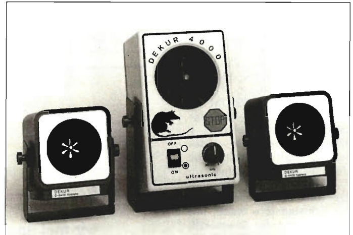
Mäuse-Verjager mit Ultraschall

haltskellern gedacht ist. Es besteht aus einem Ultraschallgenerator und zwei zusätzlichen „Lautsprechern“ – damit kann man auch drei Räume versorgen (Bezug über DEKUR, Postfach 508, 5400 Koblenz). kb