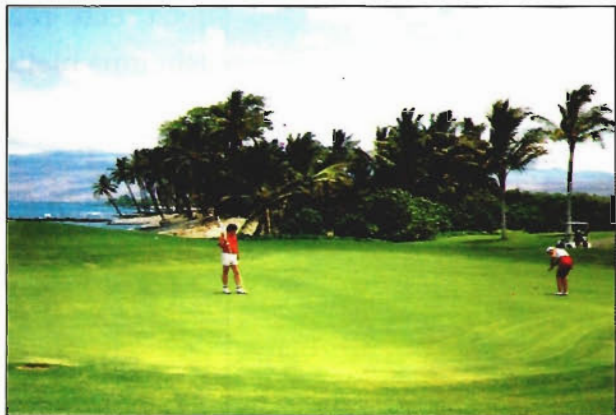
Ein riesiges Grün, wie es auf den Golfplätzen im Pazifik oder in der Karibik, aber auch im Süden der Vereinigten Staaten typisch ist, mit für Europäer ungewohnten Putt-Entfernungen zur Fahne.